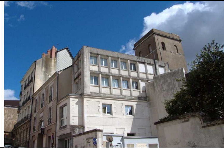
Bâtiments de l'ancienne école d'hydrographie et tour de l'observatoire (vue depuis la rue Flandres-Dunkerque-40).

Deux ouvrages complètement différents suivront en 1827, à Nantes l'observatoire astronomique de la Marine et à Gorges la manufacture de l'Angreviers de style architectural plus clissonnais.